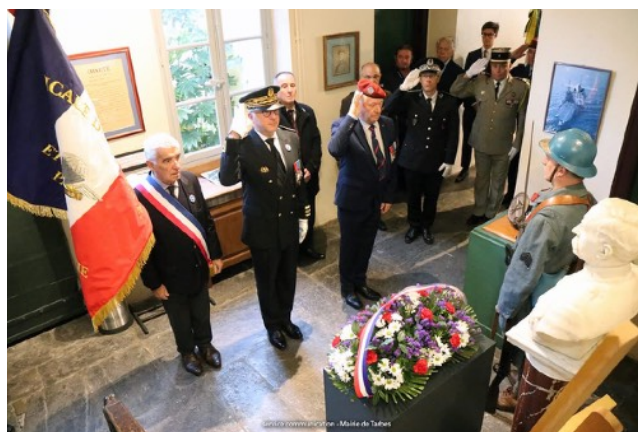
Honneurs au maréchal F. Foch - Maison natale Tarbes