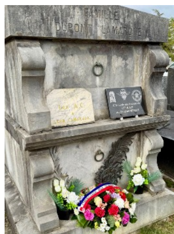
Tombe du général Mengus