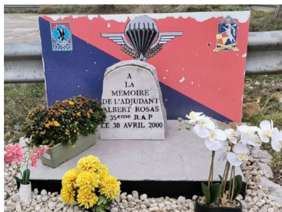
Stèle ADJ A. Rosas - Canjuers