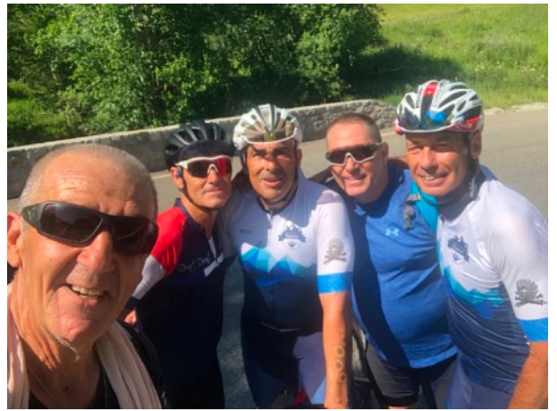
Improbable rencontre sur les pentes de Luz Ardiden" le 25 juin 2026 des cyclistes et moi.